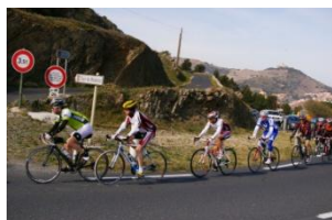
COL TOUR DE LA MADELOC