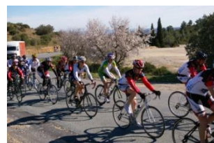
Les hauts de Feuillat